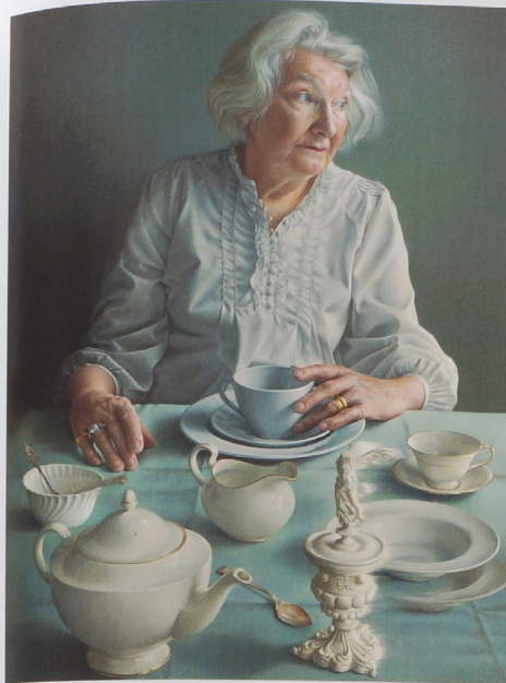
“BP肖像奖”一等奖获奖作品《我桌上的天使》 80×55厘米