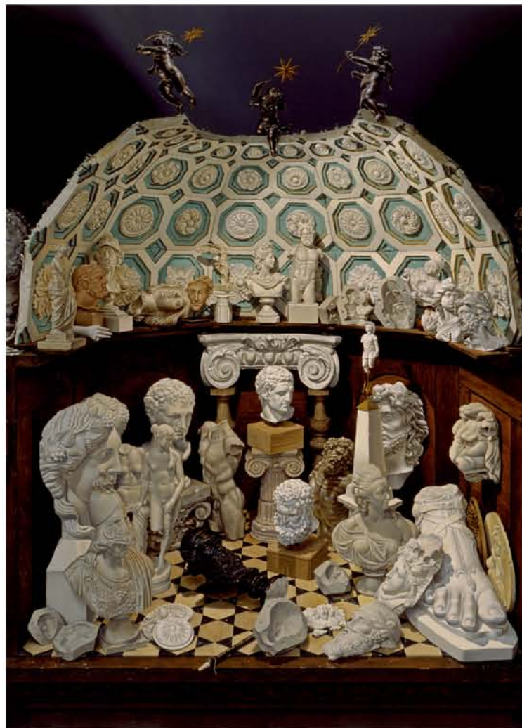
The Gypsotheque, oil on canvas 107 x 97cm

Miriam Escofet: 我现在还没有孩子。我想如有的话，他们被我的创作风格影响这是不可避免的一件事，因为他们在一个特定的环境下成长，就像我受我父亲的影响一样，但是每一个人都是一个独立的个体，艺术家的孩子也是一样道理，他们有自己的选择，没有必要一定要成为与父母一样的人。