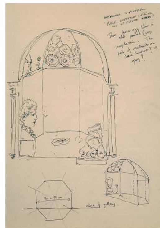
initial idea sketch

www.miriamescofet.com www.joseescofet.com