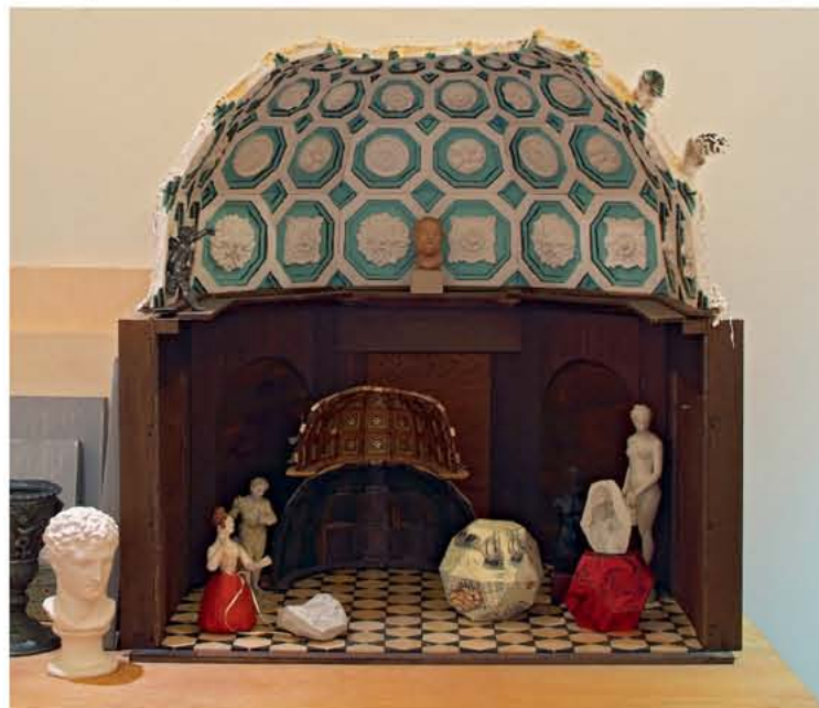
the finished model